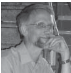
AV GÖRAN BRUSEWITZ

av "subtila energier". Många menar och bedömde att det var helt naturliga mekanismer bakom de sk kirlian-bilderna, men har missat inslagen i färg-bilderna med färg och struktur . Sk elektronemission som ligger bakom flera effekter i kirlian-bilderna kan inte förklara färg och form i bilderna.