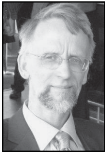
ORDFÖRANDE HAR ORDET