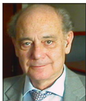
Bearbetning: EDGAR MÜLLER