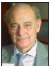
Bearbetad av EDGAR MÜLLER

Ytterligare bevis från studier utförda med EEG och magnetkamera 1)