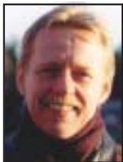
av GÖRAN GRIP

Observations on the Harvard Prayer Study av Larry Dossey i Network review , Summer 2006