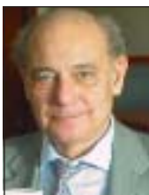
BEARBETNING: EDGAR MÜLLER