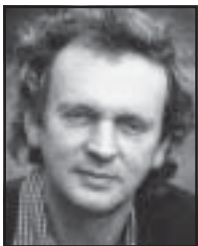
RUPERT SHELDRAKE Fil.dr. i biokemi, Cambridge